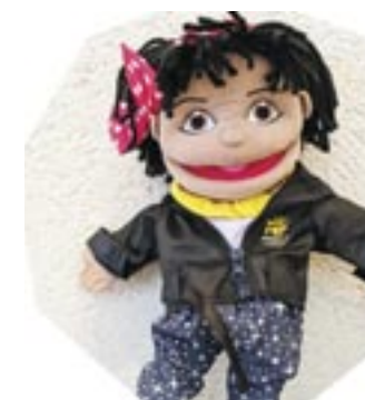
Mélodie, notre médiatrice

Lors de cette visite ludique, les enfants remonteront le temps en compagnie de Mélodie, la marionnette du Mupop, dont la tête est pleine de souvenirs. Au fil du parcours musical, Mélodie accompagnera les enfants qui l'aideront à retrouver les instruments de ses anciens propriétaires.