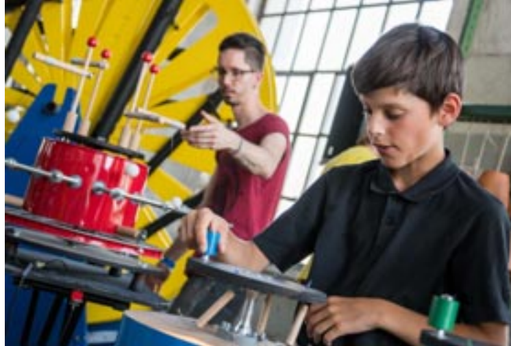
Expériences sonores avec Cric-Crac